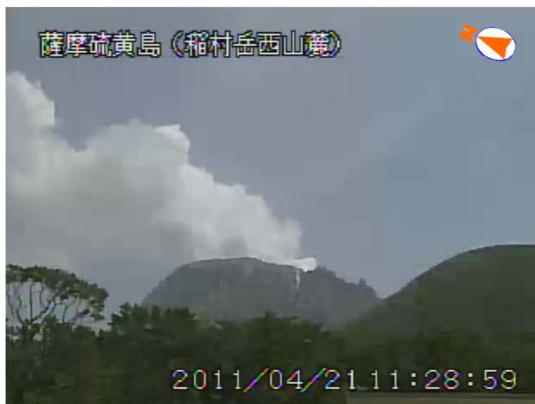
図 1 薩摩硫黄島 噴煙の状況（4 月 21 日、稲村岳西山麓遠望カメラによる）

この火山活動解説資料は福岡管区气象台ホームページ ( http://www.jma-net.go.jp/fukuoka/ ) や気象庁ホームページ ( http://www.seisvol.kishou.go.jp/tokyo/volcano.html ) でも閲覧することができます。次回の火山活動解説資料（平成 23 年 5 月分）は平成 23 年 6 月 8 日に発表する予定です。資料中の地図の作成に当たっては、国土地理院長の承認を得て、同院発行の『数値地図 10m メッシュ（火山標高）』を使用しています（承認番号：平 20 業使、第 385 号）。