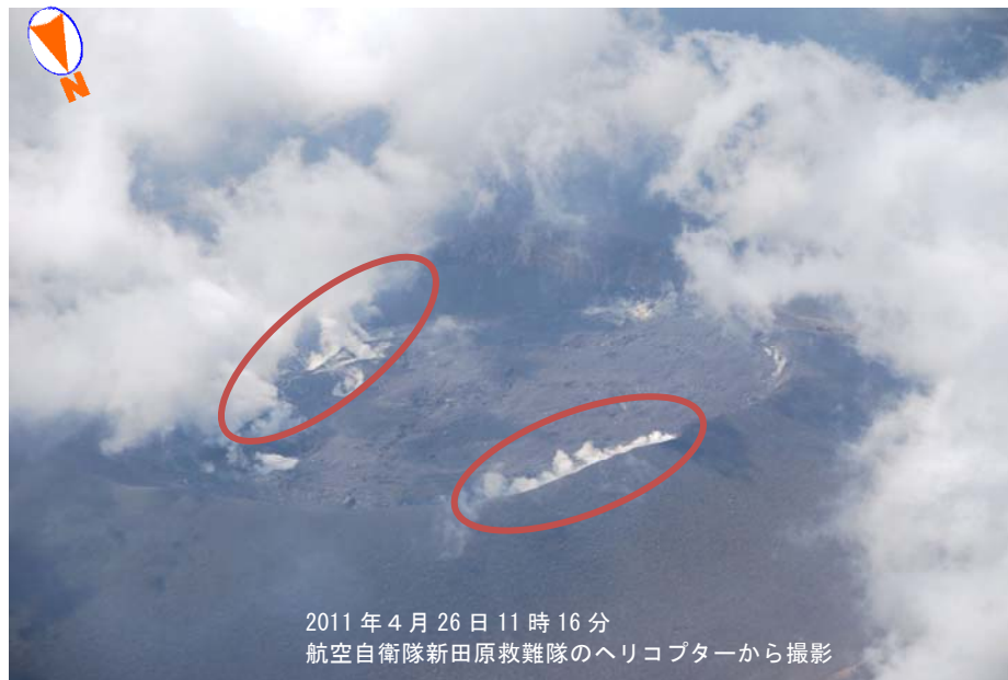
図1 霧島山（新燃岳） 火口内の状況