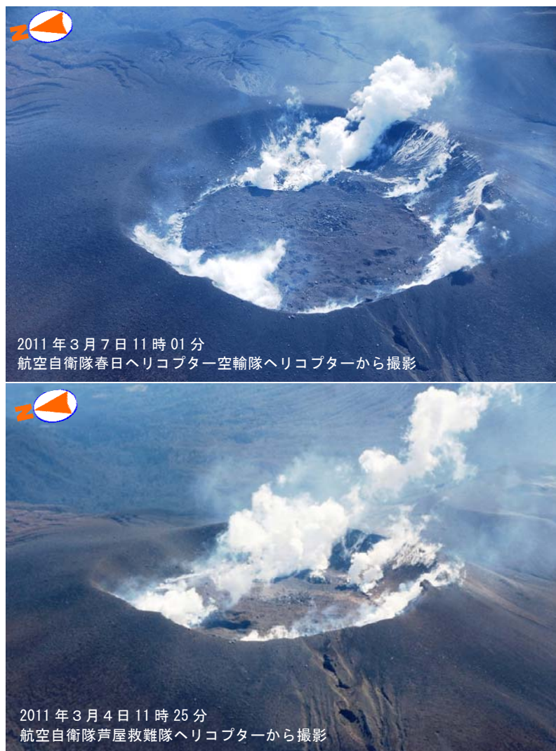
図 1 霧島山（新燃岳） 火口内の状況

気象庁の高千穂河原及び湯之野観測点の傾斜計では、火山活動に伴う大きな変化はありませんでした。