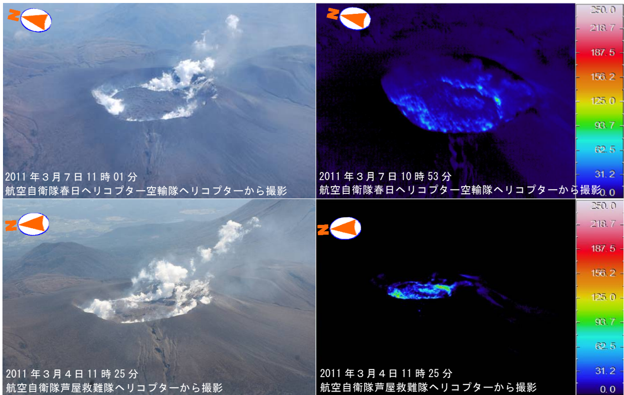
図 2 霧島山（新燃岳） 赤外熱映像装置による火口付近の地表面温度分布

前回の観測と比較して地表面温度分布に大きな変化は無く、溶岩東側の亀裂及び縁辺の噴煙量の多い部分が比較的高温でした。