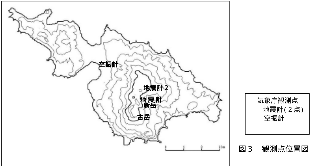
図 3 観測点位置図