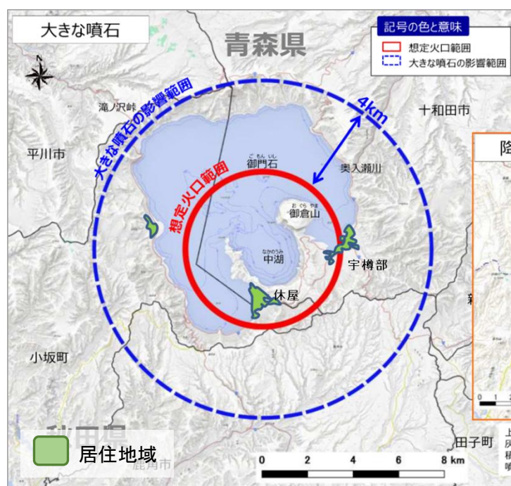
図2 十和田 現象の影響範囲（噴火の大きさ「小」）