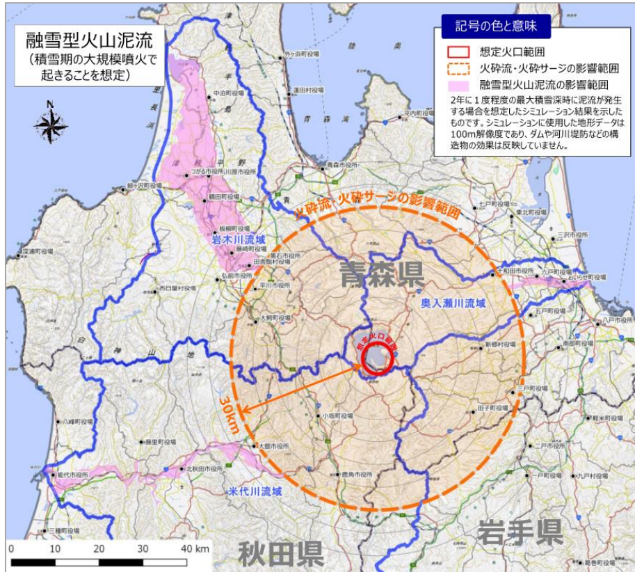
図4 十和田 現象の影響範囲（噴火の大きさ「大」）

※影響範囲は同心円状ではなく幅を持つことから、「概ね20km」として丸めた値とする