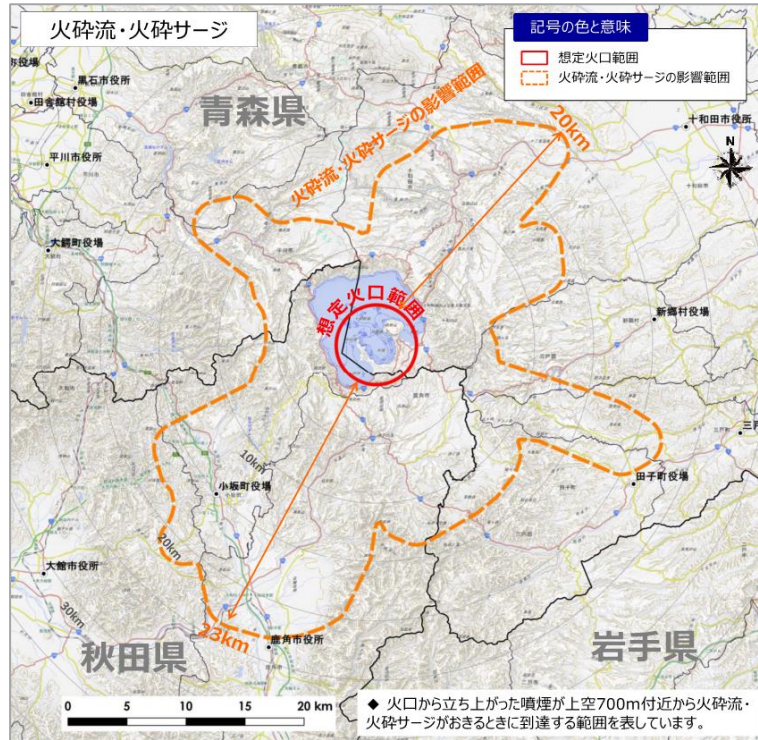
図3 十和田 現象の影響範囲（噴火の大きさ「中」）