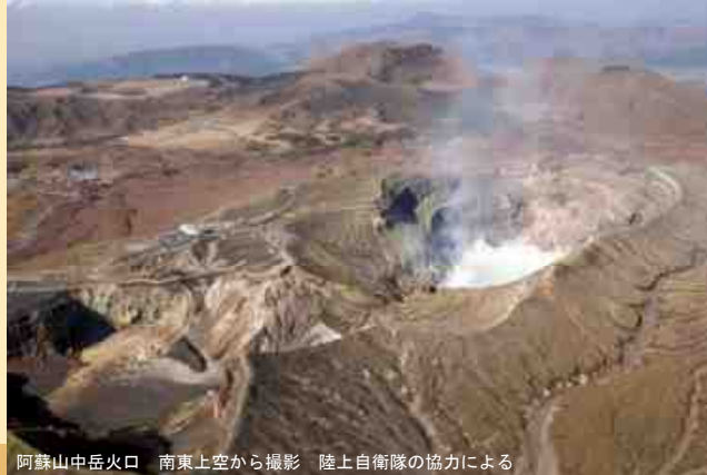
阿蘇山中岳火口 南東上空から撮影 陸上自衛隊の協力による