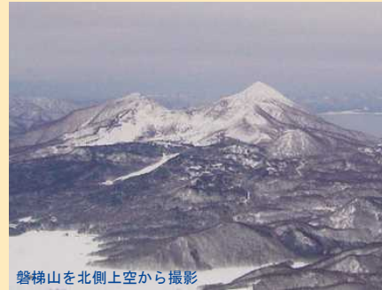
磐梯山を北側上空から撮影