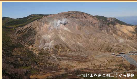
一切経山を南東側上空から撮影