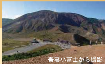
吾妻小富士から撮影