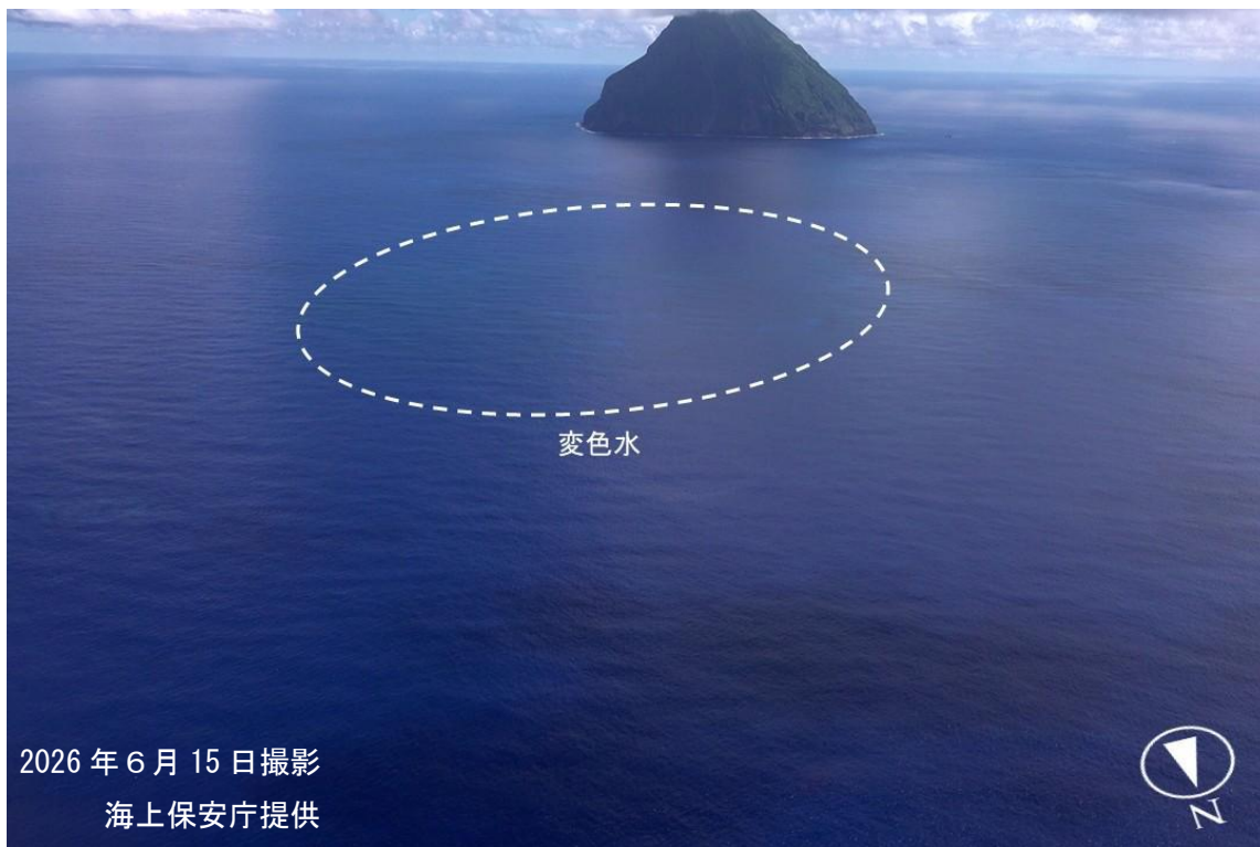
図2 福徳岡ノ場周辺の状況