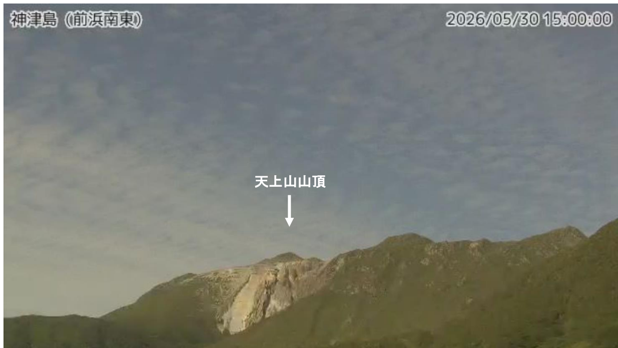
図1 神津島 天上山山頂部の状況（5月30日、前浜南東監視カメラによる）