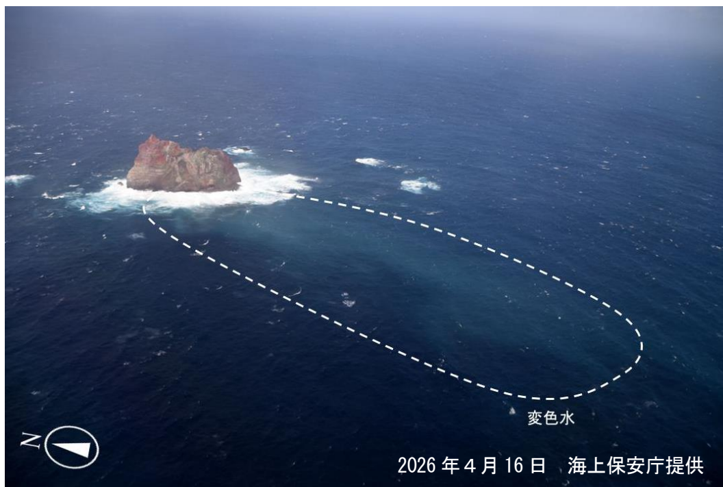
図2 須美寿島 16日の状況