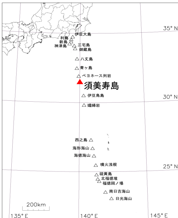
図1 伊豆・小笠原諸島の活火山分布及び須美寿島の位置図

今期間、気象衛星ひまわりでは噴火は認められていません。16日に海上保安庁が実施した上空からの観測では、須美寿島の西岸から南西側へ約1,000mにわたり、青白色の変色水が認められました。