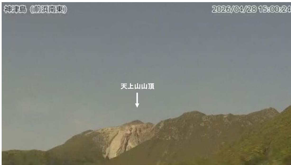
図1 神津島 天上山山頂部の状況（4月28日、前浜南東監視カメラによる）