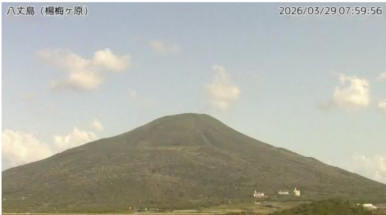
図1 八丈島 西山山頂部の状況（3月29日、楊梅ヶ原監視カメラによる）