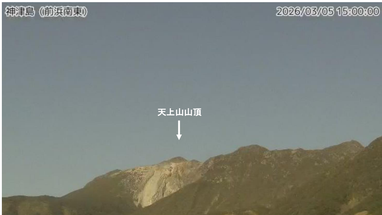
図1 神津島 天上山山頂部の状況（3月5日、前浜南東監視カメラによる）