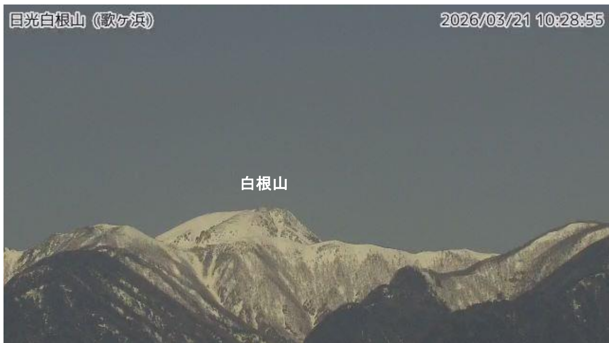
図1 日光白根山 山頂部の状況（3月21日 歌ヶ浜監視カメラによる）