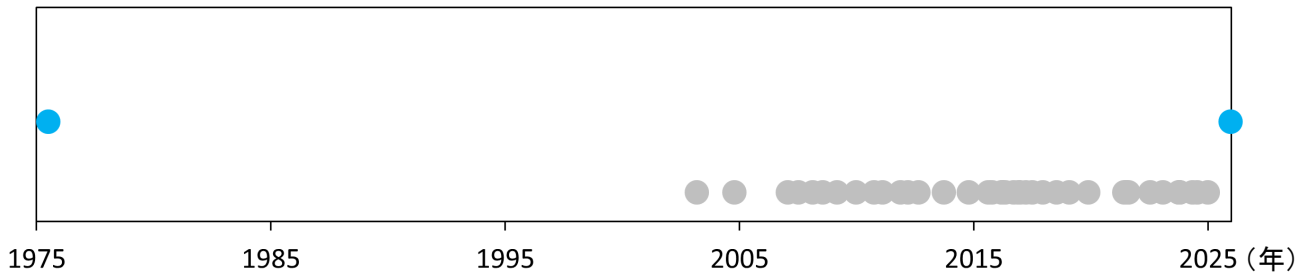
図4 嬬婦岩 1975年以降の活動状況

シンボルがあるタイミングで観測が行われています。●は変色水が認められた観測、●は変色水域等特異事象が認められなかった観測を示します。