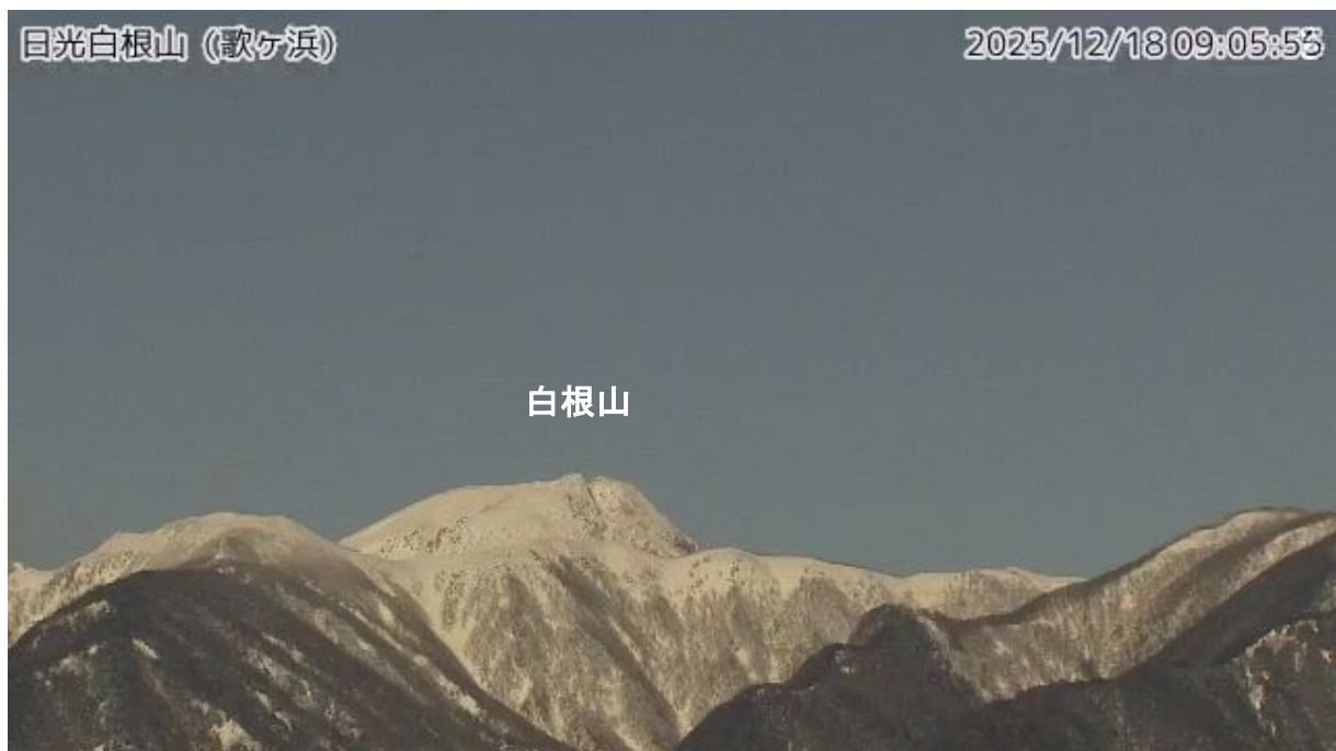
図 1 日光白根山 山頂部の状況（12 月 18 日 歌ヶ浜監視カメラによる）