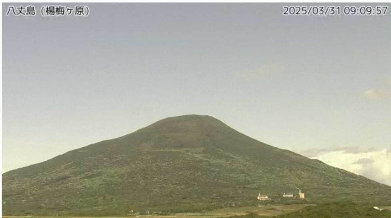
図1 八丈島 西山山頂部の状況（3月31日、楊梅ヶ原 ようめがはら 監視カメラによる）