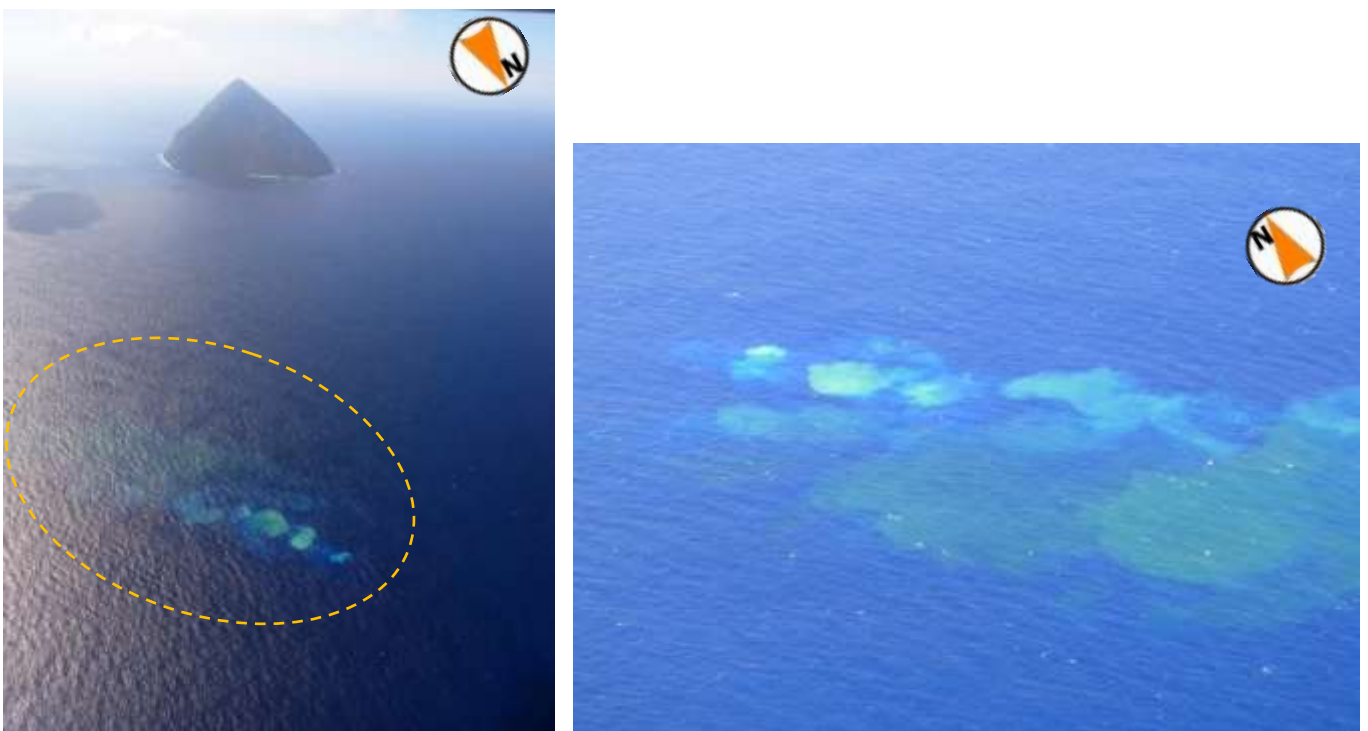
図 3 福徳岡ノ場 変色水の状況