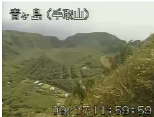
図 2 青ヶ島 丸山西斜面の状況 (9月17日 手取山遠望カメラによる)