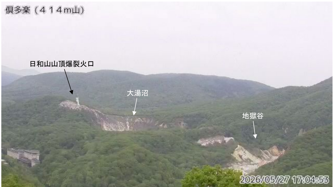
図1 倶多楽 南西側から見た日和山、大湯沼及び地獄谷周辺の状況（414m山監視カメラによる） ・日和山山頂爆裂火口、大湯沼、地獄谷では噴気が確認されています。