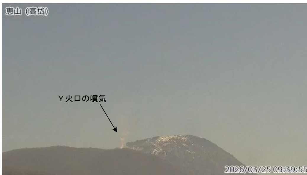
図1 恵山 南西側から見た山頂部の状況（高岱 たかだい 監視カメラによる）