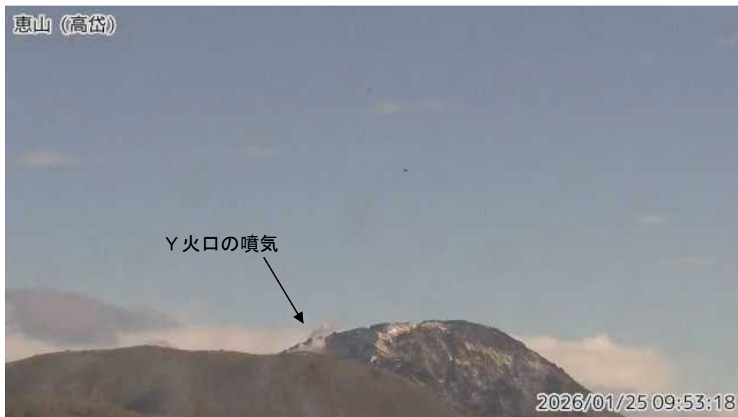
図1 恵山 南西側から見た山頂部の状況（ ただい 高岱監視カメラによる）