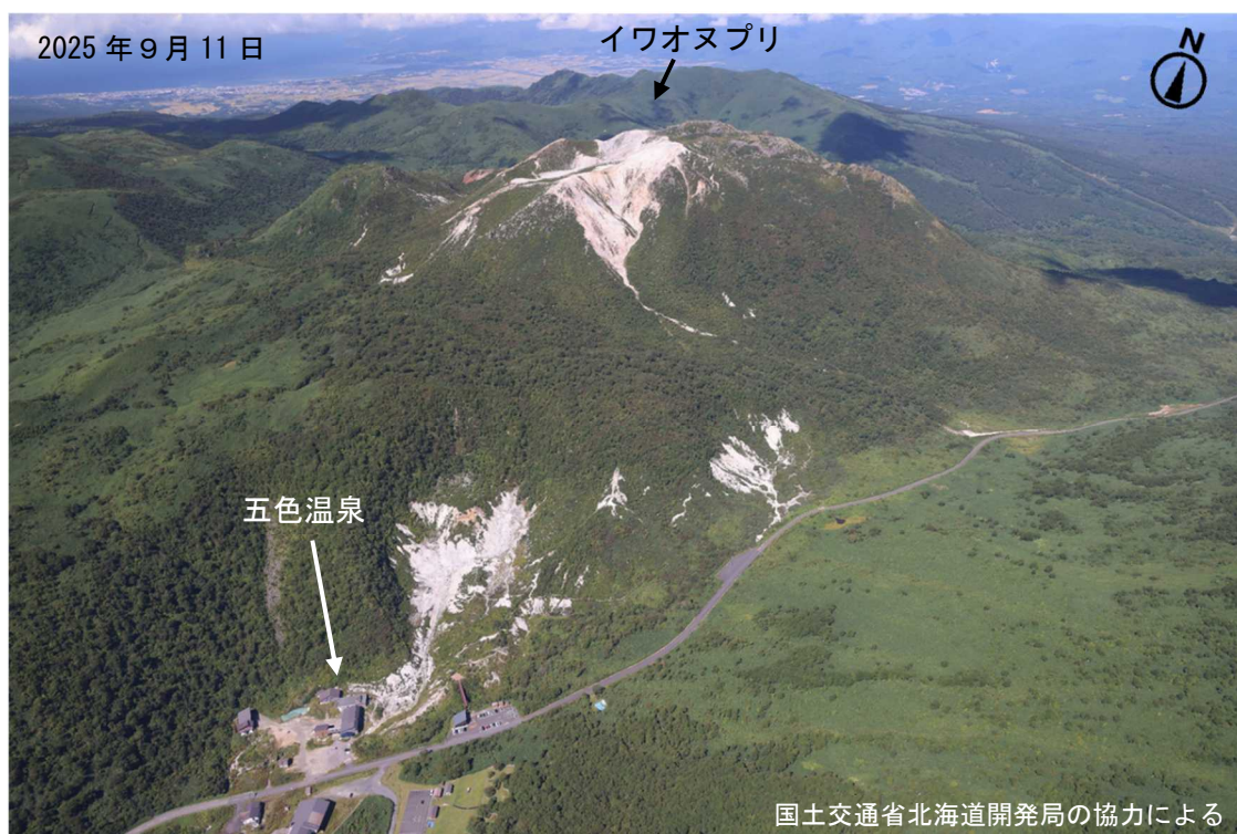
図 2 ニセコ イワオヌプリ及び五色温泉周辺の状況 南側上空（図 1 の①）から撮影