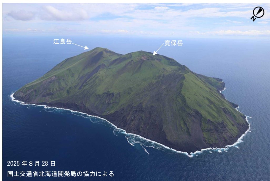
図2 渡島大島 島全体の状況 北西側上空（図1の①）から撮影