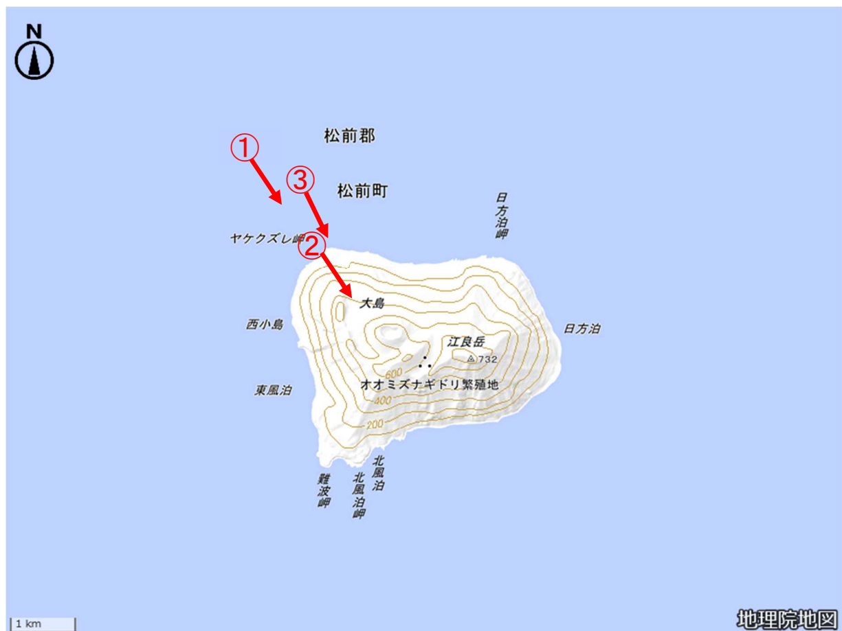
図1 渡島大島 写真及び赤外熱映像の撮影方向（矢印）

8月28日に国土交通省北海道開発局の協力により実施した上空からの観測では、山頂部の寛保岳（中央火口丘）及びその周辺に噴気は認められず、地形や植生にも特段の変化はありませんでした。また、赤外熱映像装置による観測では、寛保岳の火口南東側内壁にこれまでと同様に弱い地熱域を確認しました。