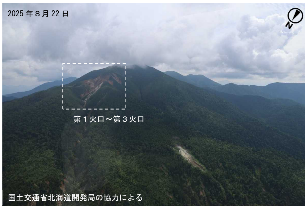
図2 丸山 北西斜面に位置する火口列の状況 北西側上空（図1の①）から撮影 ・第1火口～第3火口に噴気は認められませんでした。