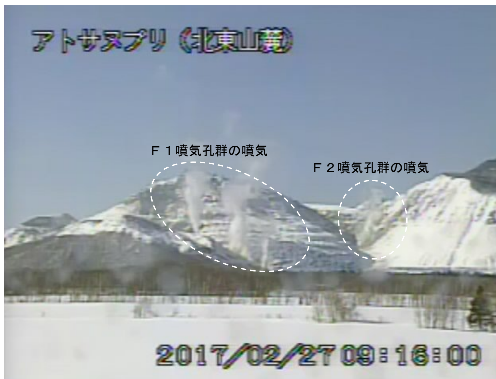
図2 アトサヌプリ 北東側から見た山体の状況 (2月27日、北東山麓監視カメラによる)