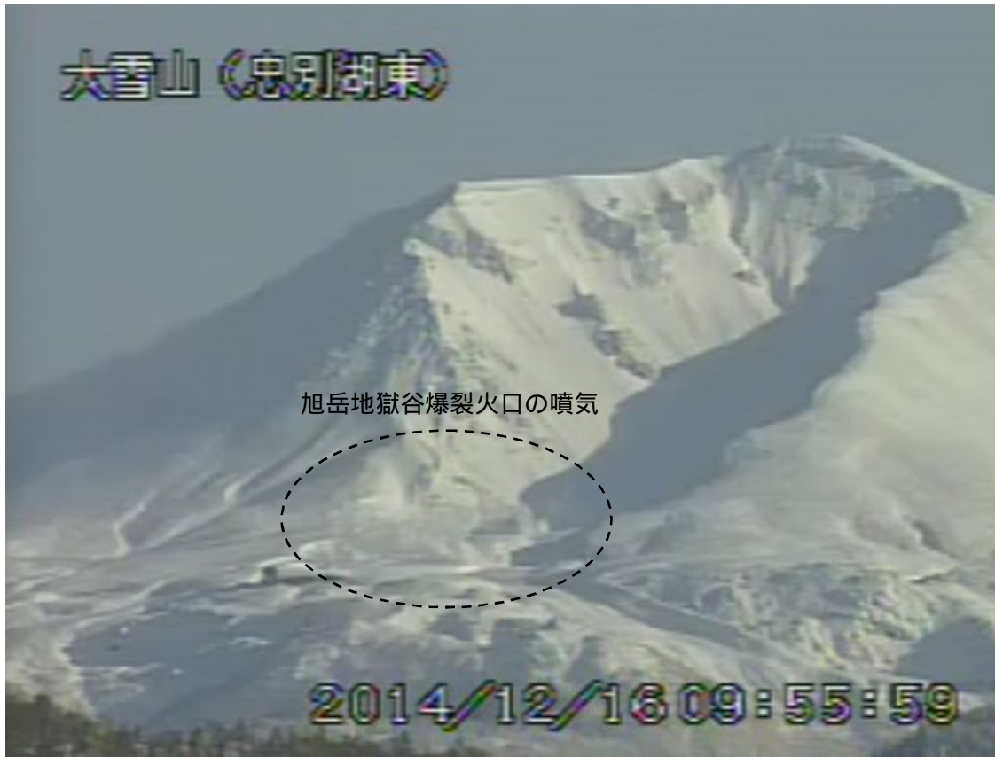
図2 大雪山 西側から見た旭岳の状況(12月16日、 ちゅうべつこひがし 忠別湖東遠望カメラによる)