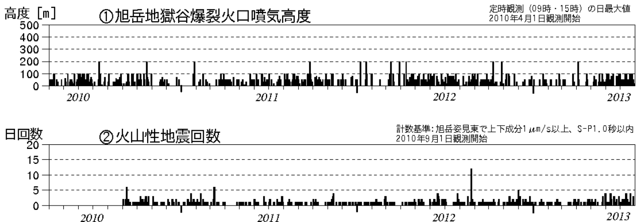
図1 大雪山 火山活動経過図（2010年4月～2013年7月）

この火山活動解説資料は札幌管区气象台のホームページ( http://www.jma-net.go.jp/sapporo/ )や気象庁のホームページ( http://www.seisvol.kishou.go.jp/tokyo/volcano.html )でも閲覧することができます。