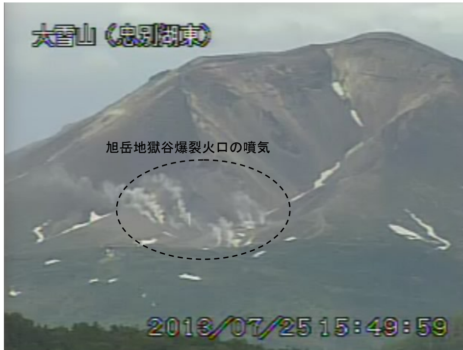
図2 大雪山 西側から見た旭岳の状況 (7月25日、忠別湖東遠望カメラによる)