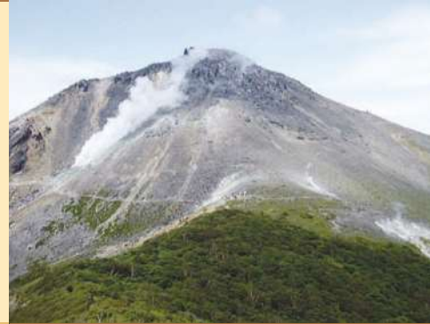
那須岳の火山活動について 1408年から1410年の活動時に、火砕流が発生し、さらに茶臼岳溶岩ドームが形成されました。この噴火で180余名が犠牲になりました。