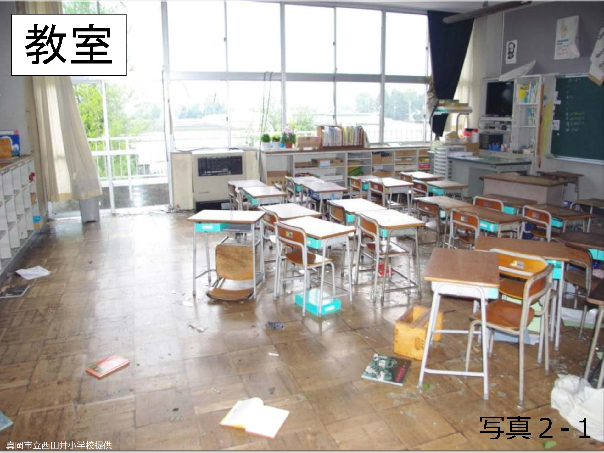
写真 2 - 1