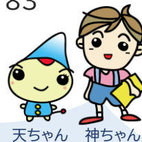
天ちゃん 神ちゃん