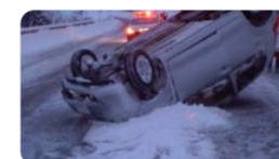
▲冬用タイヤやチェーン装着の呼びかけ (東日本高速道路会社(12月29日))

NEXCO東日本 (関東) 6日 【早めの冬装備】雪道対策は進んでいますか？雪道では、自分の運転技術や車の性能を過信せず、先を読み、無理をせず、冬用タイヤの装着やタイヤチェーンの携行など万全の装備を心掛けましょう！