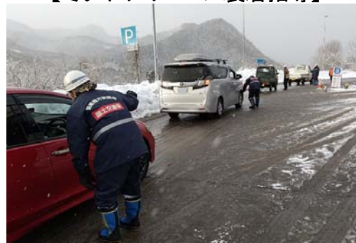
▲国道17号でのチェーン装着指導状況 (高崎河川国道事務所(12月19日))