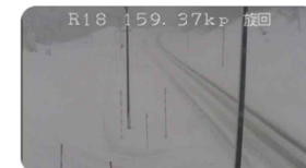
▲路面状況やチェーン装着の呼びかけ (長野国道事務所(12月31日))

国土交通省 長野国道事... 5日 国道18号野尻付近は、31日9時00分現在、積雪があり路面が滑りやすくなっています。ご通行の際には注意して頂くとともに冬用タイヤの装着やタイヤチェーンの携行をお願いします。