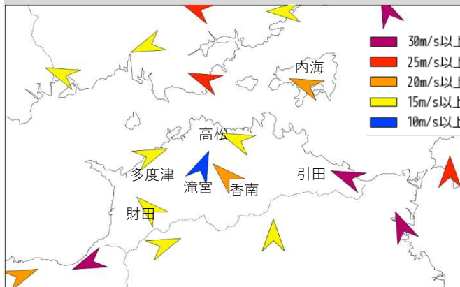
風の状況(日最大瞬間風速)(期間:9月19日)