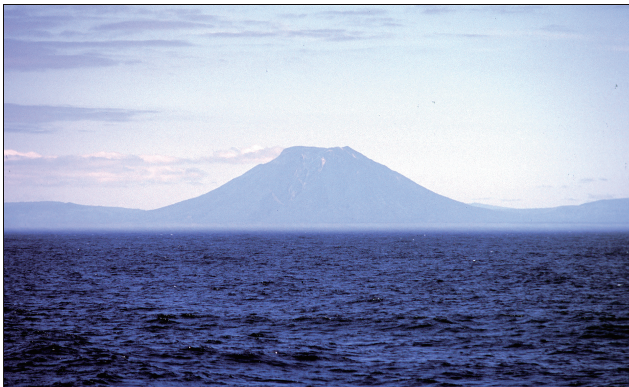
茂世路岳全景 東北東側海上から