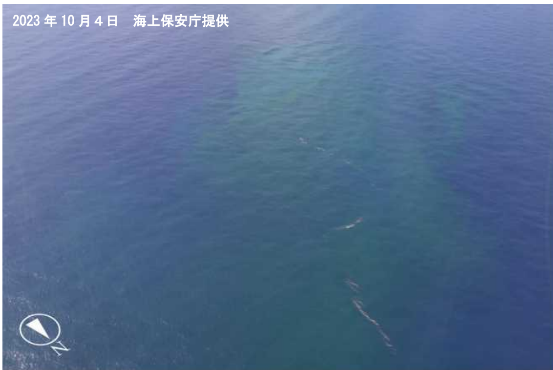
図1 福德岡ノ場 4日の状況

4日に海上保安庁が実施した上空からの観測結果によると、福德岡ノ場のほぼ直上に薄い黄緑色～薄い緑色の変色水と、発生源は不明ですが帯状の茶褐色の浮遊物が認められました（図1）。