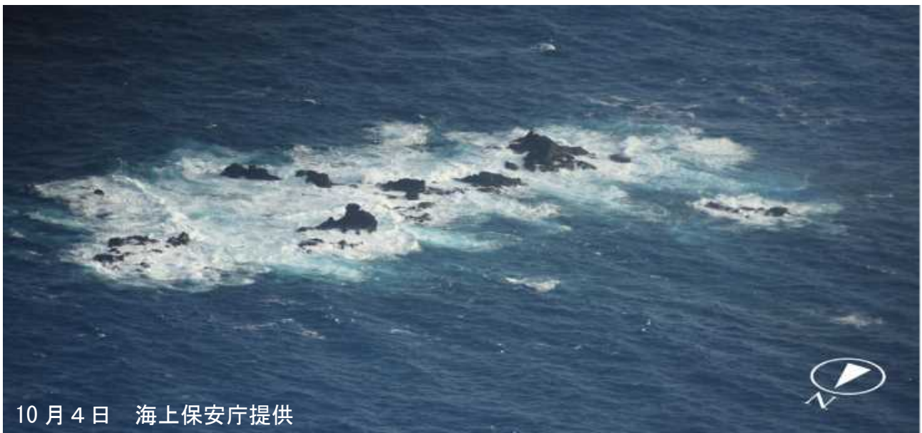
図1 ベヨネース列岩 4日の状況

今期間、気象衛星ひまわりでは噴火は認められておりません。4日に海上保安庁が実施した上空からの観測（図1、図4）によると、ベヨネース列岩及び明神礁付近（図3）で変色水域、気泡、浮遊物等の特異事象は認められませんでした。