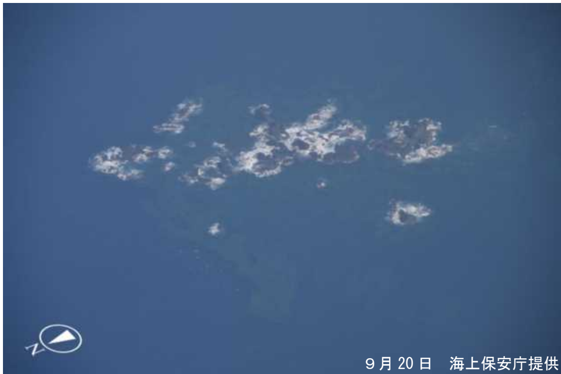
図1 ベヨネース列岩 20日の状況

今期間、気象衛星ひまわりでは噴火は認められておりません。20日に海上保安庁が実施した上空からの観測（図1、図4）によると、ベヨネース列岩及び明神礁付近（図3）で変色水域、気泡、浮遊物等の特異事象は認められませんでした。