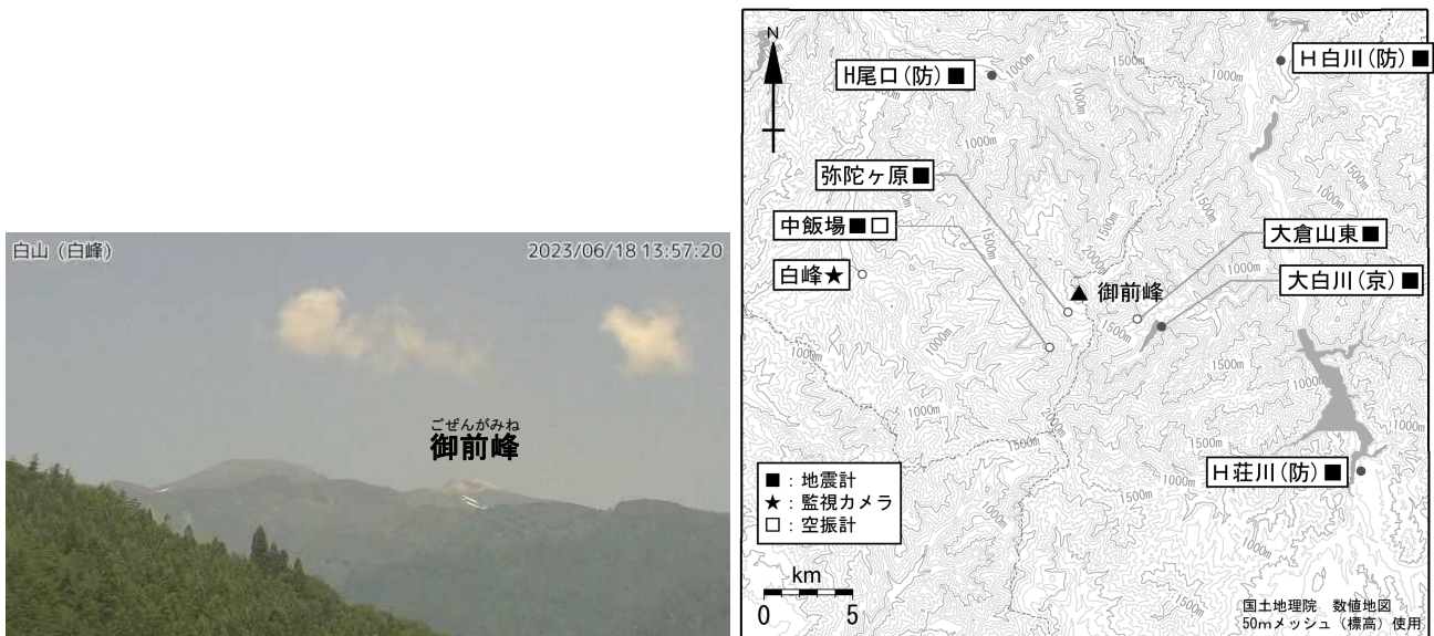
図1 白山 山頂部の状況 （6月18日 白峰監視カメラによる）

小さな白丸（○）は気象庁、小さな黒丸（●）は気象庁以外の機関の観測点位置を示しています。 （防）：防災科学技術研究所、（京）：京都大学防災研究所