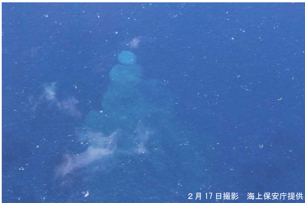
図1 明神礁付近の変色水

今期間、気象衛星ひまわりでは噴火は認められておりません。17日に海上保安庁が実施した上空からの観測によると、ベヨネース列岩（明神礁）付近（図3）で、円形状（半径約300m）に分布する薄緑色の変色水が認められました。また、変色水は明神礁付近から南に約2km程度、帯状に分布していることも確認されました。