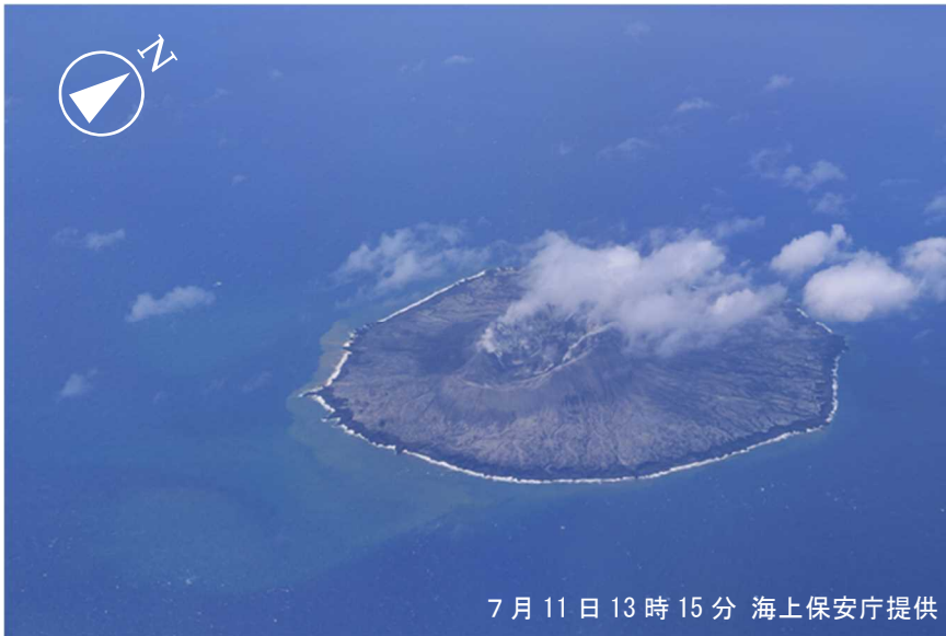
図2 西之島 上空からの観測による西之島の状況（7月11日 海上保安庁観測）