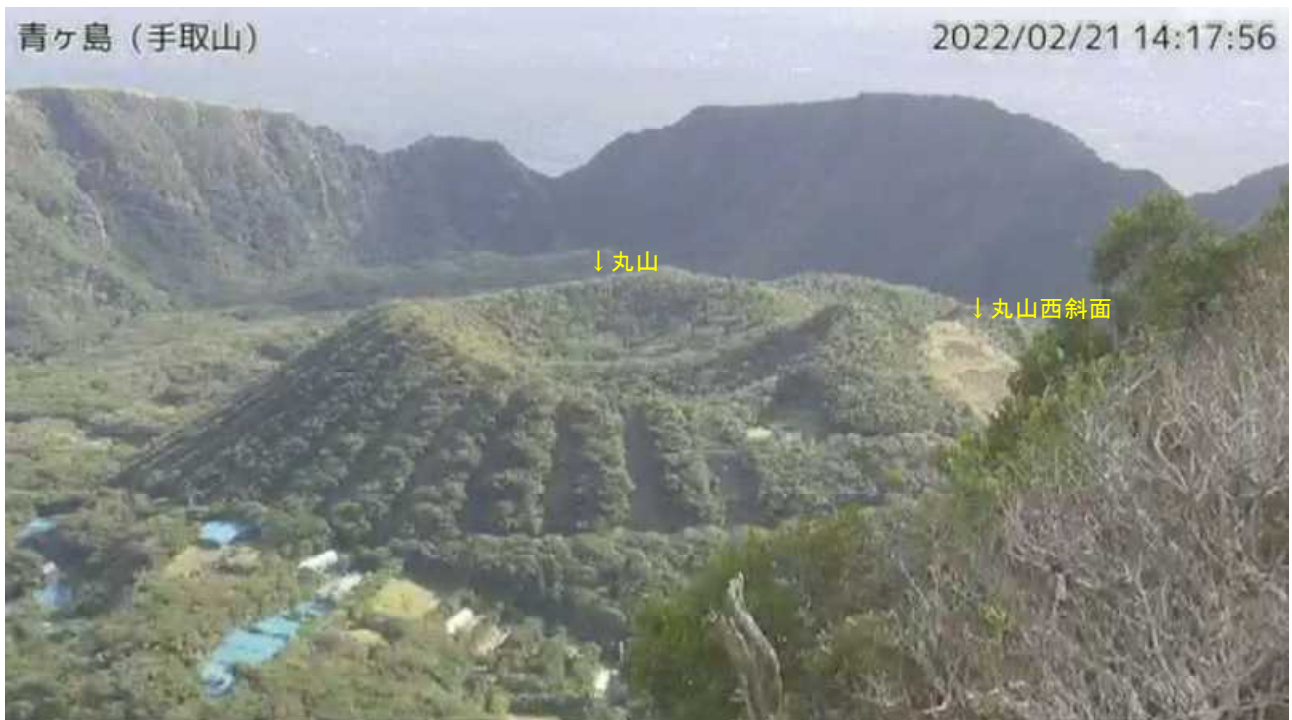
図1 青ヶ島 丸山周辺の状況（2月21日 手取山監視カメラによる）

この火山活動解説資料は気象庁ホームページ（ https://www.data.jma.go.jp/vois/data/tokyo/STOCK/monthly_v-act_doc/monthly_vact.php ）でも閲覧することができます。