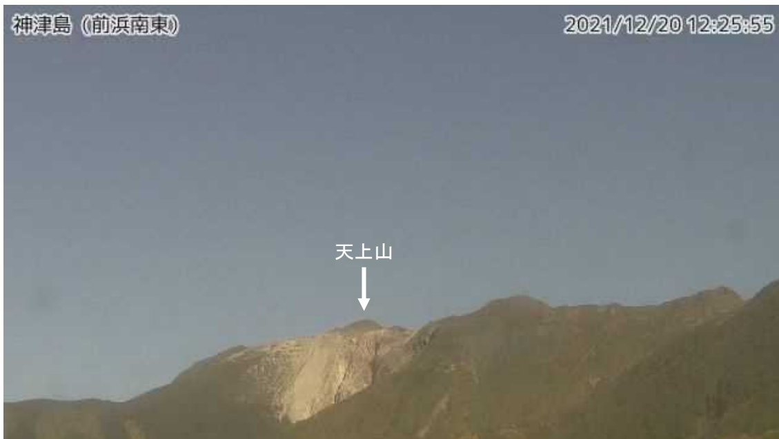
図1 神津島 天上山山頂部の状況 (12月20日、前浜南東監視カメラによる)

GNSS 連続観測及び傾斜計による観測では、火山活動によるとみられる変動は認められません。