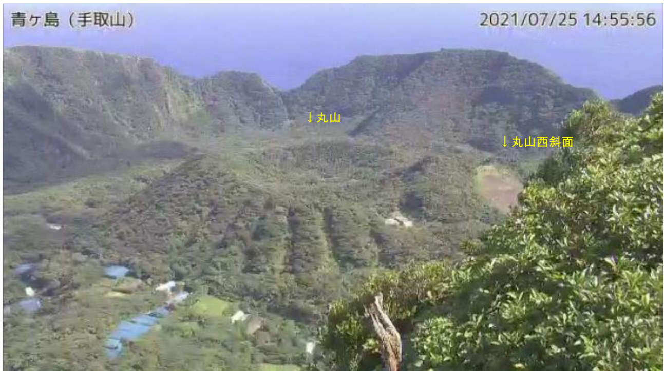
図1 青ヶ島 丸山周辺の状況（7月25日 手取山監視カメラによる）

この火山活動解説資料は気象庁ホームページ（ https://www.data.jma.go.jp/svd/vois/data/tokyo/STOCK/monthly_v-act_doc/monthly_vact.php ）でも閲覧することができます。