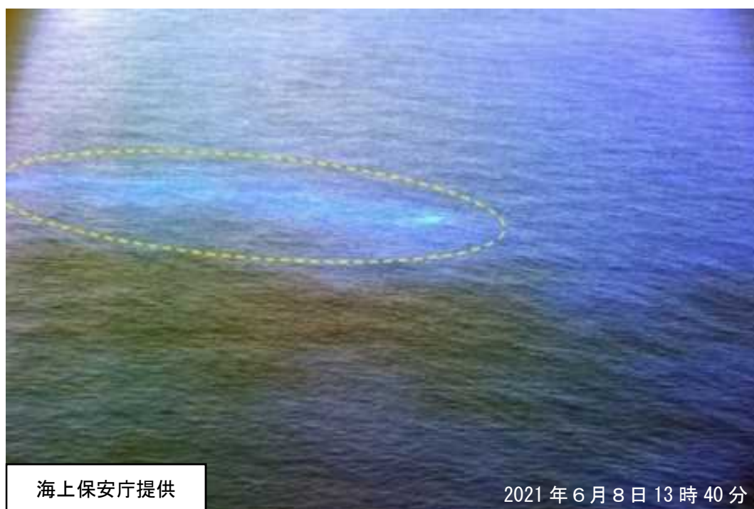
図1 福德岡ノ場 海上保安庁が実施した上空からの観測結果（6月8日） ・8日に海上保安庁が実施した上空からの観測では、青白色の変色水域が認められました。

8日に海上保安庁が実施した上空からの観測では、青白色の変色水域が認められました（図1）。 海上保安庁、第三管区海上保安本部、海上自衛隊及び気象庁によるこれまでの観測によると、福德岡ノ場付近の海面には長期にわたり火山活動によるとみられる変色水等が確認されています（図2）。 2010年2月3日には小規模な海底噴火が発生しています。