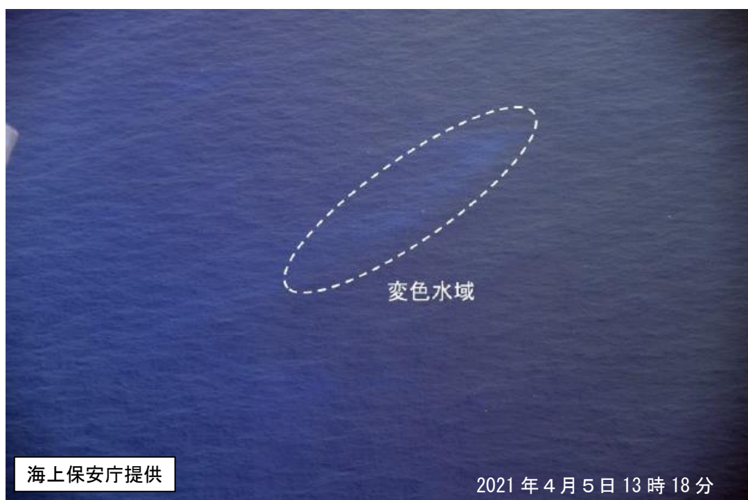
図1 福德岡ノ場 海上保安庁が実施した上空からの観測結果（4月5日）

海上保安庁、第三管区海上保安本部、海上自衛隊及び気象庁によるこれまでの観測によると、福德岡ノ場付近の海面には長期にわたり火山活動によるとみられる変色水等が確認されています（図2）。2010年2月3日には小規模な海底噴火が発生しています。