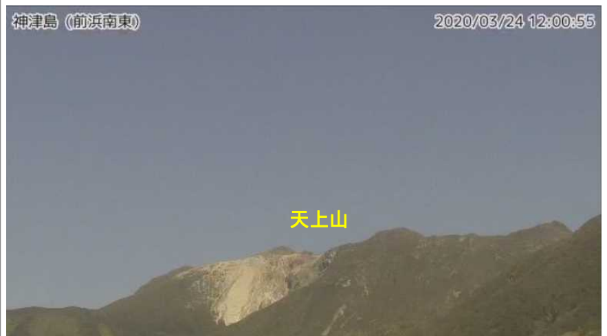
図2 神津島 天上山山頂部の状況 （3月24日、前浜南東監視カメラによる）