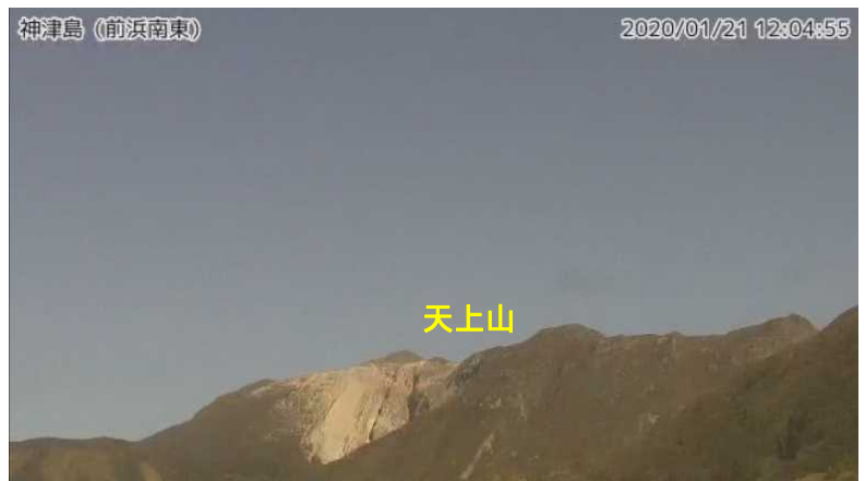
図2 神津島 天上山山頂部の状況 （1月21日、前浜南東監視カメラによる）

GNSS基線 ~ は図3の ~ に対応しています。 神津島1から神津島1Aに2014年9月19日移設。