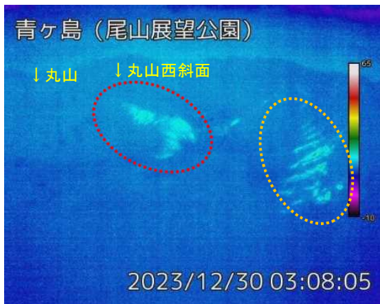
12月30日 尾山展望公園監視カメラ