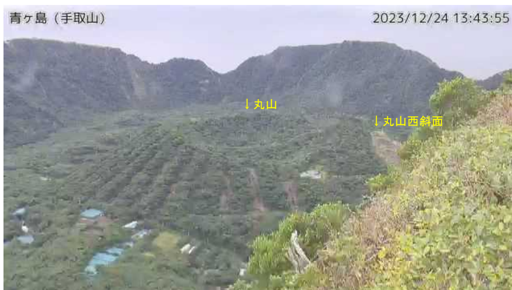
図1 青ヶ島 丸山西斜面の状況（12月24日、手取山監視カメラによる）