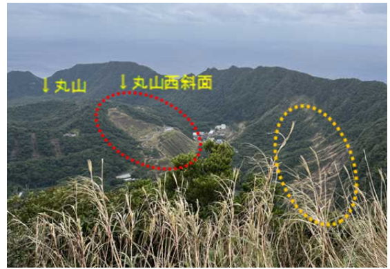
2023年2月2日に撮影した同場所からの写真