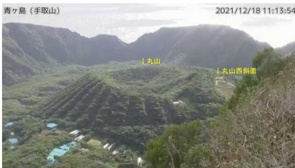
図1 青ヶ島 丸山西斜面の状況（12月18日、手取山監視カメラによる）

GNSS連続観測及び傾斜観測では、火山活動によるとみられる変動は認められません。