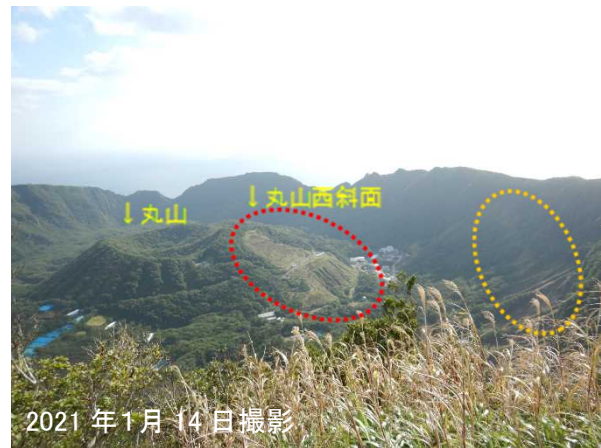
2021年1月14日撮影 2021年1月14日に撮影した同場所からの写真