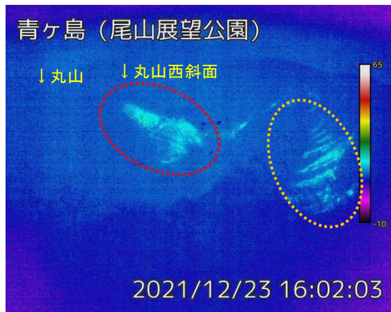
12月23日 尾山展望公園監視カメラ